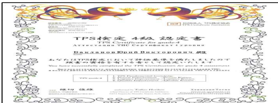
<TPS 4급 자격증>