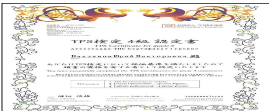
<TPS 4급 자격증>